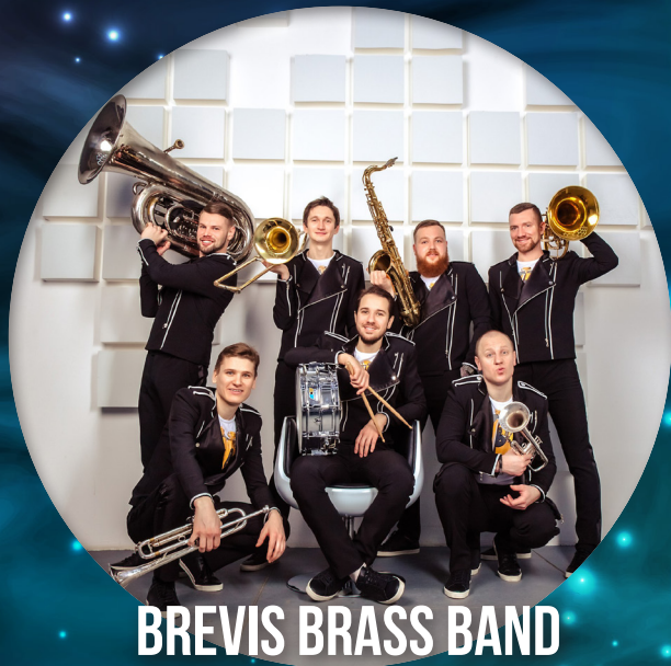
BREVIS BRASS BAND

Уникальный коллектив из Москвы. Их сольные выступления уже традиционно проходят с аншлагом и sold-out. Двигатели brass-культуры, Brevis Brass соединили в своем творчестве популярную музыку в оригинальных аранжировках, зажигательные танцы и мощную подачу, создав настоящее шоу. Brass Band — это музыкальный ансамбль, полностью состоящий из медных духовых инструментов, как правило, дополненных ударной секцией. Brevis Brass Band сумел совместить несколько основных музыкальных стилей, которые определили культуру brass-движения по всему миру.